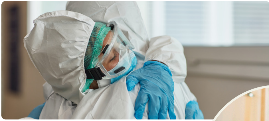
Pandemin visade på brister i välfärden. Vänsterpartiet vill bygga samhället starkt igen.

att välfärden ska bli sämre hela tiden, det beror helt på politiska beslut. Vi måste ta tillbaka kontrollen över skola, vård, omsorg och infrastruktur. Det fungerar inte att ge mindre och mindre pengar till verksamheter som dessutom ska ge en allt större andel av de pengarna till privata bolagsvinster. Det har slagit sönder välfärden och skapat otrygghet.