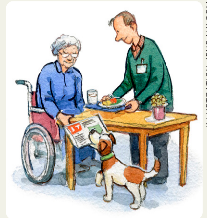
ILLUSTRATION: JENS AHLBOM