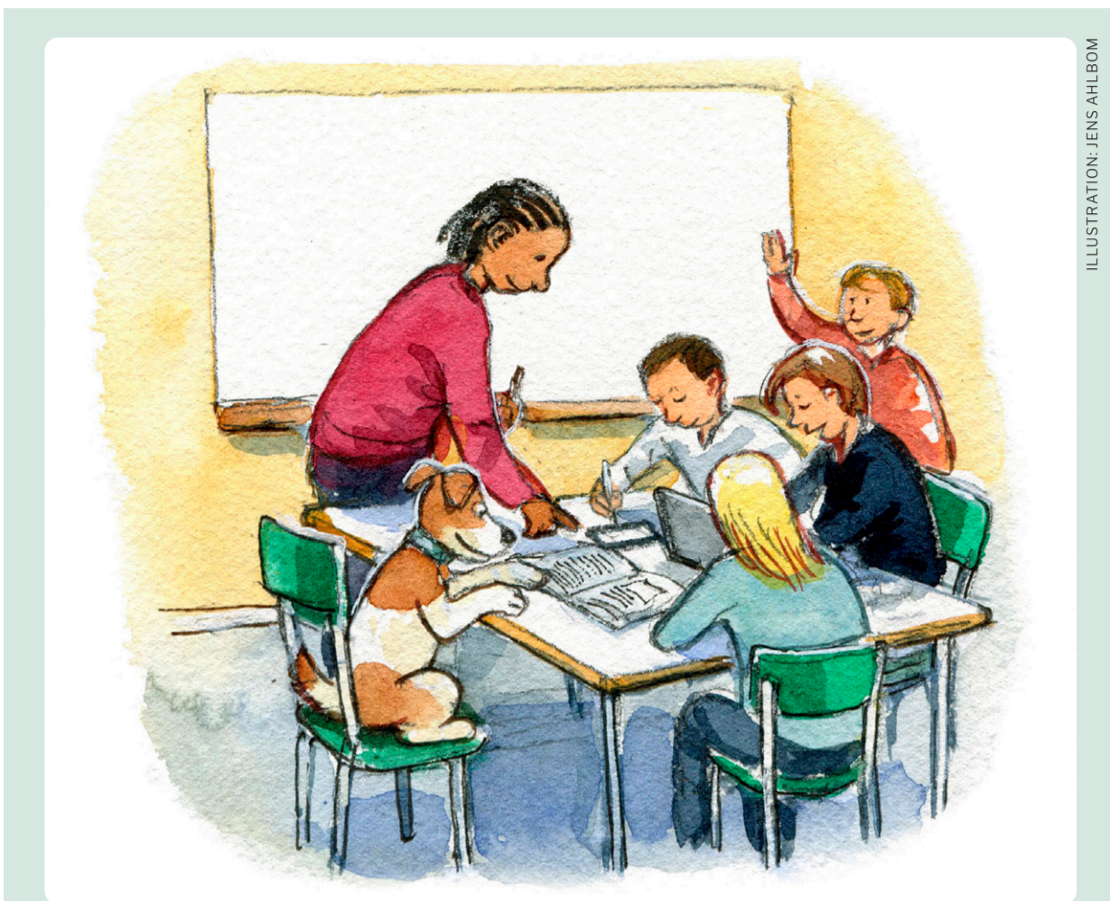
ILLUSTRATION: JENS AHLBOM

– Viktigast för mig är att minska klyftorna i vår kommun genom att skapa möjligheter till arbete på lång sikt, för grupper som har svårt att komma in på arbetsmarknaden.